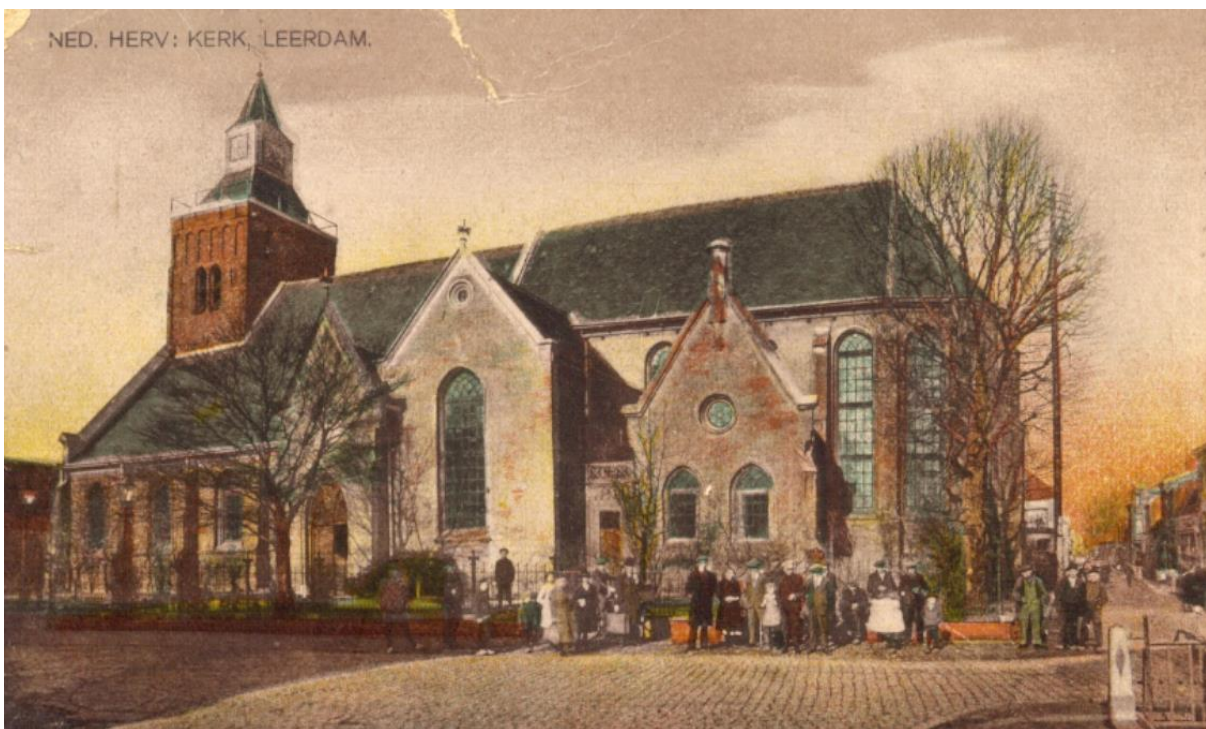
Grote Kerk (Beeldbank Historische Vereniging Leerdam)

De rooms-katholieke eredienst zal dan wel verboden zijn. Hoe ging het met hun geestelijken? Vertrokken zij uit de stad naar elders? En waren er ook nog inwoners die niets van de gereformeerde leer moesten hebben? Hoe tolerant was men ten opzichte van elkaar?