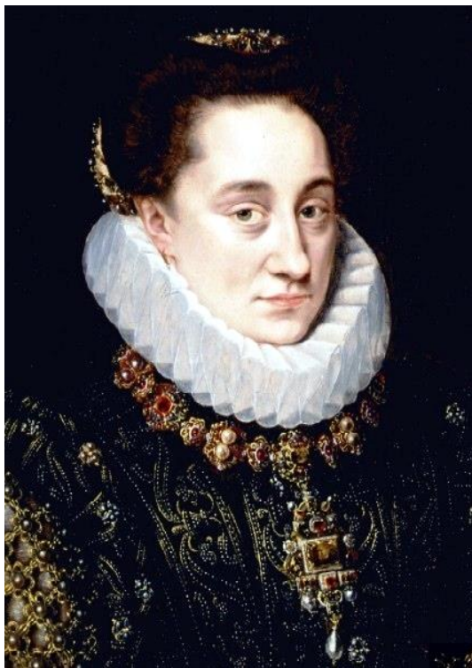
Maria van Nassau, door Adriaen Thomasz Key Olieverf op paneel, 480 x 340 mm (Museum Het Prinsenhof, Delft)