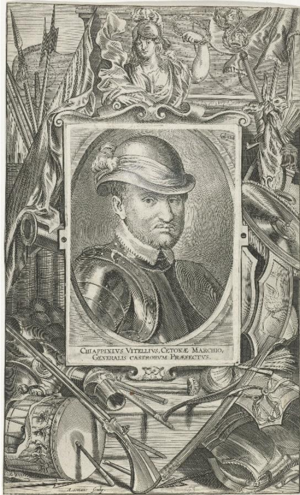
Chiapini Vitelli, door Arnold Loemans Gravure op papier, 263 x 159 mm (Rijksmuseum, Amsterdam)