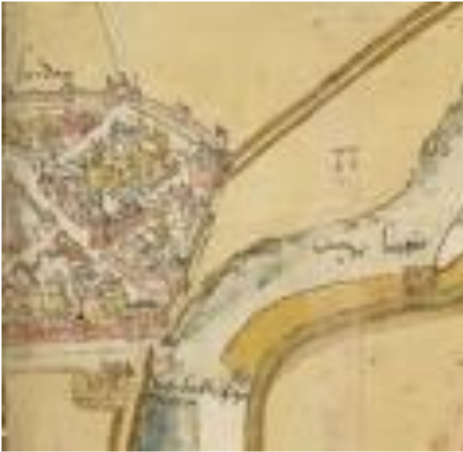
Vogelvluchttekening Leerdam met rechts in de uiterwaard prominent de galg. Detail uit: Kaart van de limietscheiding tussen de Grafelijkheid van Holland en de heer van half Asperen, enz., 1549

Hoe nu verder? Requesens gaf last aan graaf De la Roche, gouverneur van Holland en Utrecht, commissarissen te zenden naar de veroverde plaatsen, naast Leerdam o.m. Buren, Woudrichem, Asperen en Heukelum, om de orde te handhaven, plundering tegen te gaan, aan de klachten der ingezetenen tegemoet te komen, de kerken te herstellen, de terugkeer der geestelijken te bevorderen en de uitoefening van de rooms-katholieke eredienst te verzekeren. Hij verzocht de medewerking van de aartsbisschop van Utrecht voor de kerkelijke belangen. Aangezien er in Leerdam al een kerkenraad was, kunnen we ook wel aannemen dat de kerk in het bezit van de hervormden was gekomen. Maar daar zal nu wel een eind aan gekomen zijn.